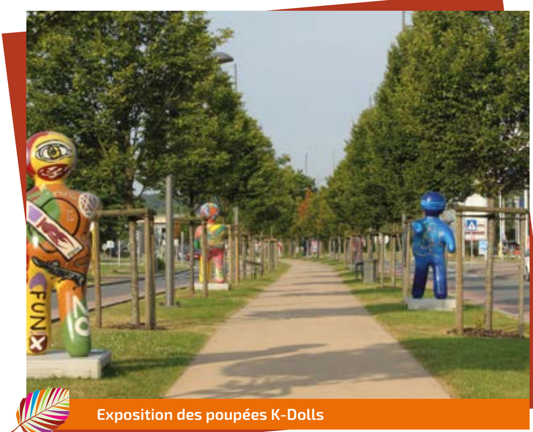
Exposition des poupées K-Dolls

Dans quelques mois, les problèmes d'embouteillage vont singulièrement diminuer car le contournement va absorber un flux important du trafic automobile et autre bonne nouvelle, le TEC vient de mettre en adjudication les travaux nécessaires pour que les bus puissent stationner ou s'arrêter en dehors des bandes de circulation.