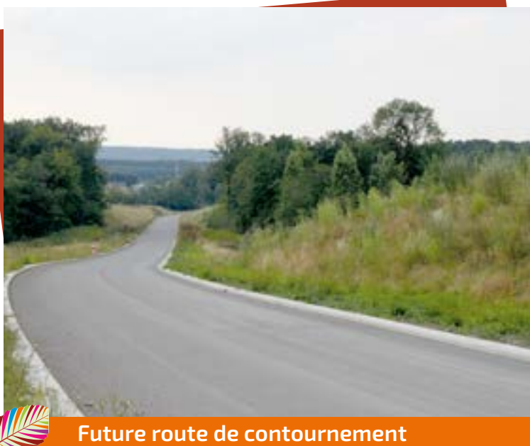
Future route de contournement