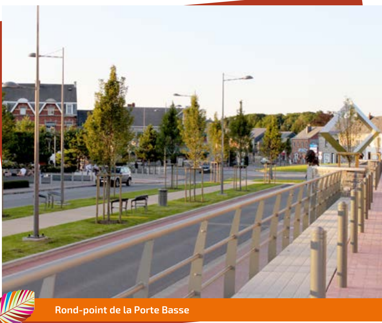
Rond-point de la Porte Basse