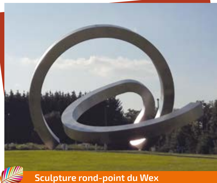
Sculpture rond-point du Wex